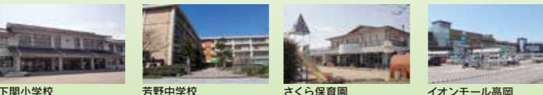
下関小学校 芳野中学校 さくら保育園 イオンモール高岡