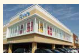
ファボーレ婦中店