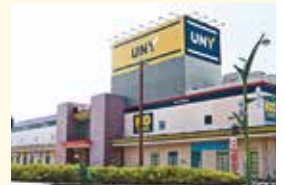
MEGAドン・キホーテUNY砺波店