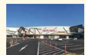
イオンモール砺波