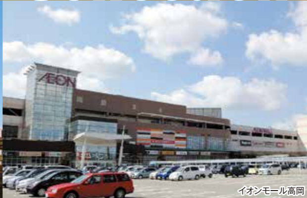
イオンモール高岡