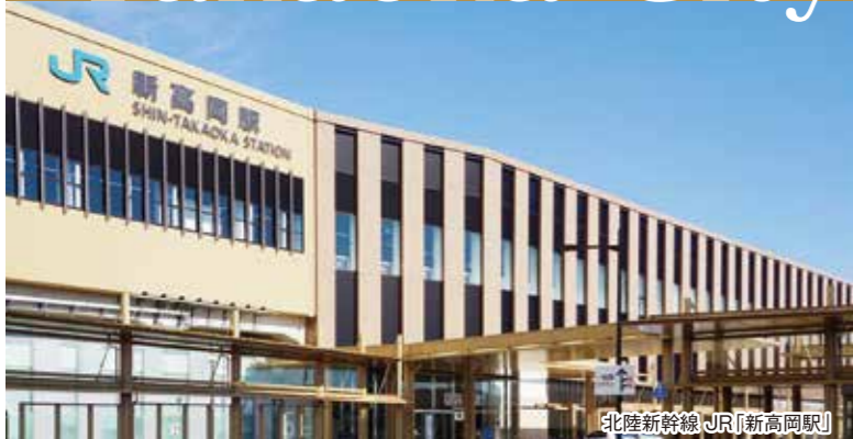
北陸新幹線JR[新高岡駅]