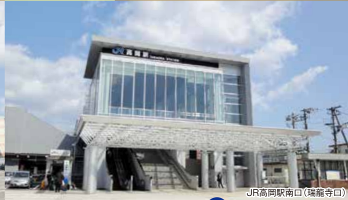
JR高岡駅南口(瑞龍寺口)